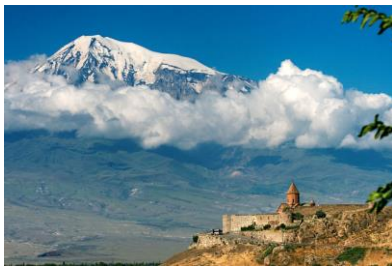
Klooster van Khor Virap & de Ararat

Voor beide reizen hebben we 21 deelnemers en daarmee zijn de reizen volgeboekt. De voorlichtingsbijeenkomst voor deze reis wordt op 20 maart gehouden in Nijkerk. De deelnemers krijgen hier nog bericht over.